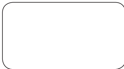
Blanc RAL 9002